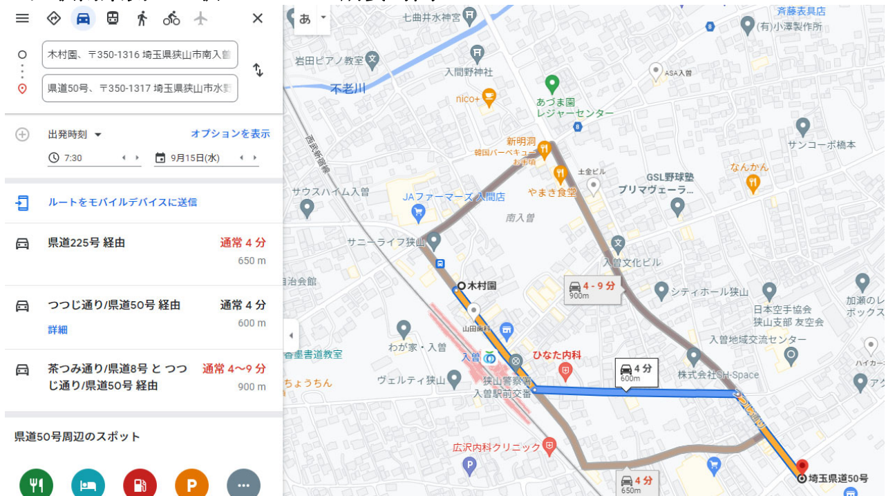
図 水野(月見野)交差点から入曽駅東口駅前広場予定地付近までの経路案内(Google Map)