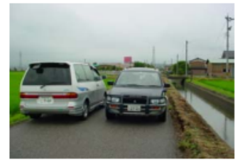
交通安全上支障が生じている道路②の様子