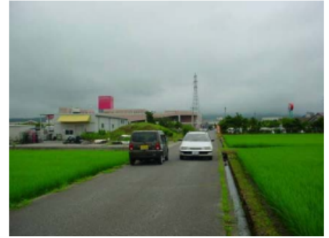
交通安全上支障が生じている道路①の様子