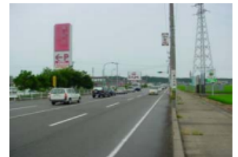
主たる進入路の様子